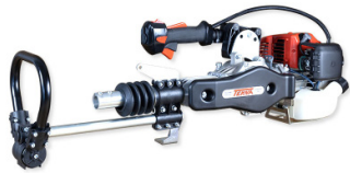
Nuevo sistema antivibratorio para mayor comodidad del usuario