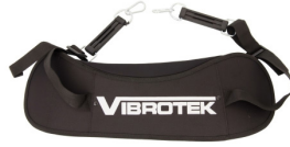
Cómodo arnés acolchado